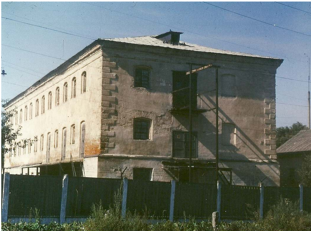
Здание бывшей тюрьмы в середине 1990-х гг.

разрешил выйти из тюрьмы. Перед тюремными воротами кто-то из охраны выстрелил в неё и убил наповал.