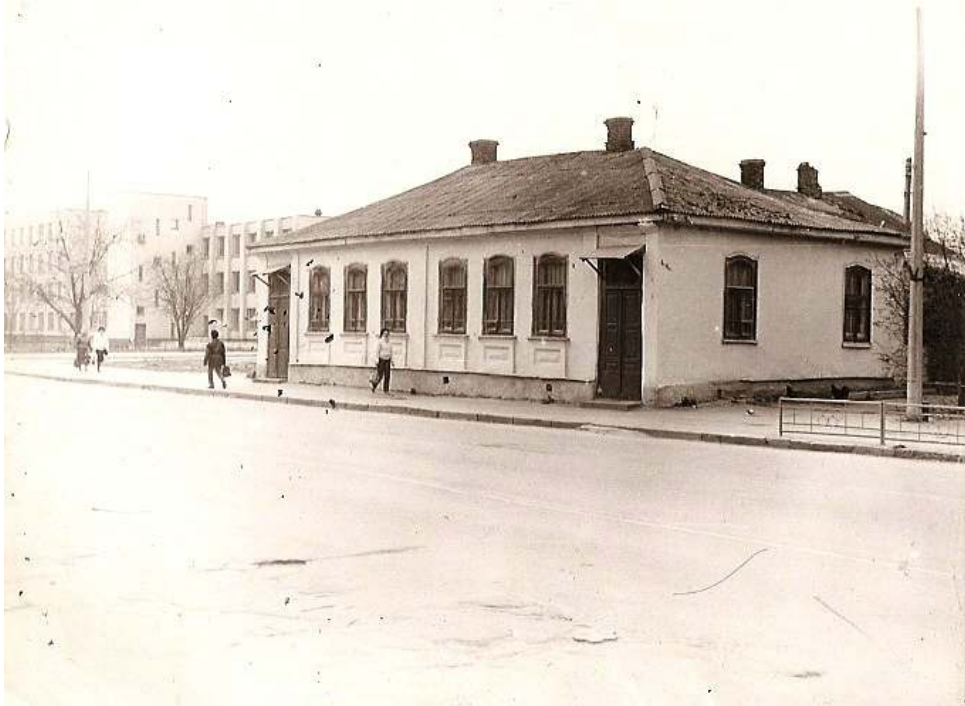
Дом по ул. Ленина, в котором до войны находилась столовая УНР (начало 1990-х гг.)