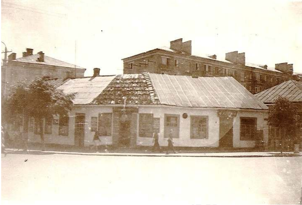
Дом на углу улиц Ленина и К.Маркса (Международной) в середине 1960-х гг.