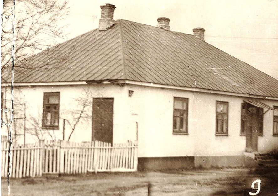
Вид дома по ул. Дзержинского №9 в 1960-х гг.