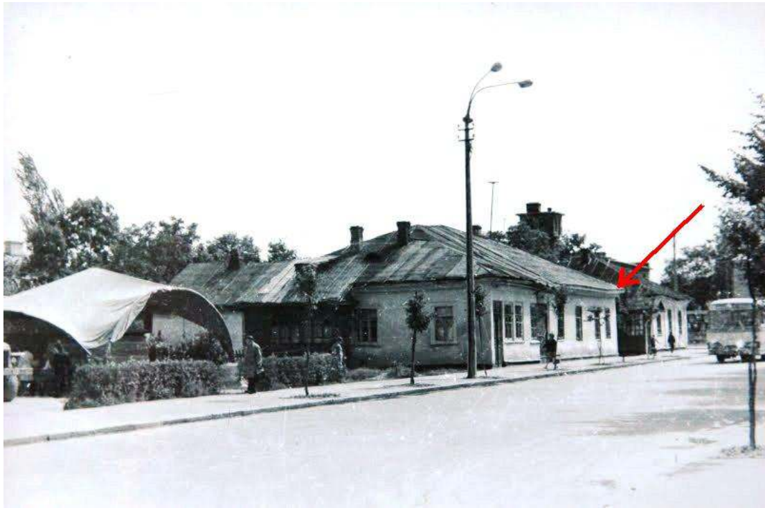
Дом по ул. К.Маркса (Международной) №11 в 1970-х гг.