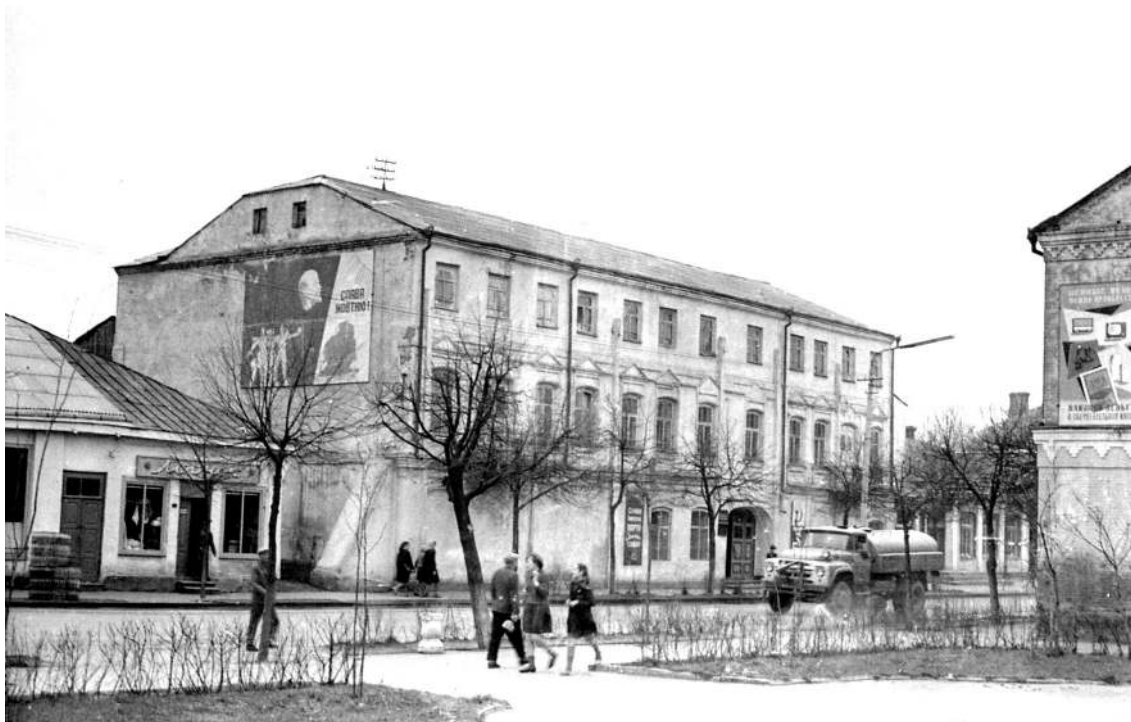
3-этажный Дом культуры на противоположной стороне ул.Ленина в 1960-х гг.

Мы смотрели немецкие кинофильмы в старом кинотеатре по ул. Ленина. Примерно в начале 1942 г. демонстрировали документальный фильм студии UFA, в котором немецкий офицер смотрел через бинокль на звёзды Кремля. 7 ноября 1943 г. перед киносеансом выступил немец в униформе: «Ну, вот, мы выровняли линию фронта по Днепру. Будем с большевиками воевать».