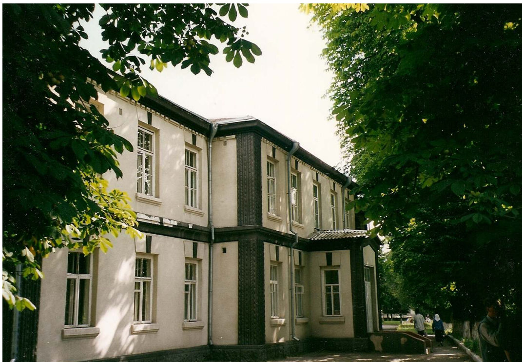
Инфекционное отделение больницы

Через дорогу от него, со стороны ул. Больничной, стояло одноэтажное здание терапевтического отделения и недостроенное двухэтажное здание. К последнему приходили местные жители и разбирали рамы.