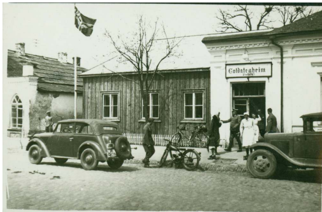
Soldatenheim по ул. Международной, 1941-42 гг.

взрывчатку. От взрыва повывлетали окна. На столе осталась записка: «Здесь был Калашник».