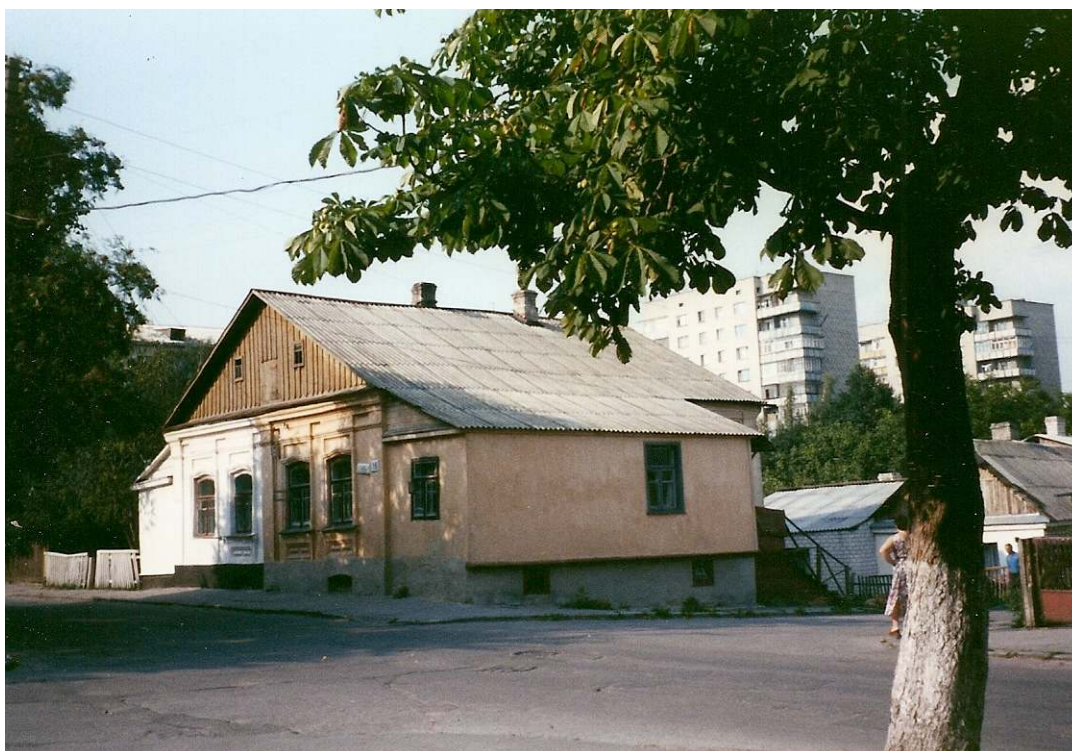
Дом на углу улиц Р.Люксембург и Щорса в начале 2000-х гг.

Позже брал книги в библиотеке в пионерском клубе на ул. Советской (там сейчас контора хлебзавода). Книги были моим главным увлечением. Библиотекарша заводила новый формуляр и проверяла меня: «А ну-ка, расскажи, как называется книга, кто её автор, о чём там пишется». Я очень быстро пересказывал содержание. Библиотекарша пожимала плечами и предлагала мне другие книги.