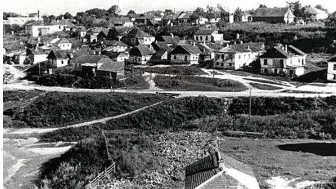
Вид домов на ул. Кузнечной (снято во время оккупации)

Недалеко от моста через р. Случь, у Т-образного перекрёстка, где шоссе пересекается с дорогой, ведущей к Дому Красной Армии, стояли два немца в униформе. Они выборочно подходили к повозкам, говорили по-русски, но с сильным акцентом. Один из них больше обратил внимание не на нас, а на женщину с типичными еврейскими чертами лица, ехавшую на другой повозке. Потом направились к нам. Мама показалась им похожей на еврейку. Спрашивали, откуда мы, и велели сразу по прибытию в Новоград идти в гетто.