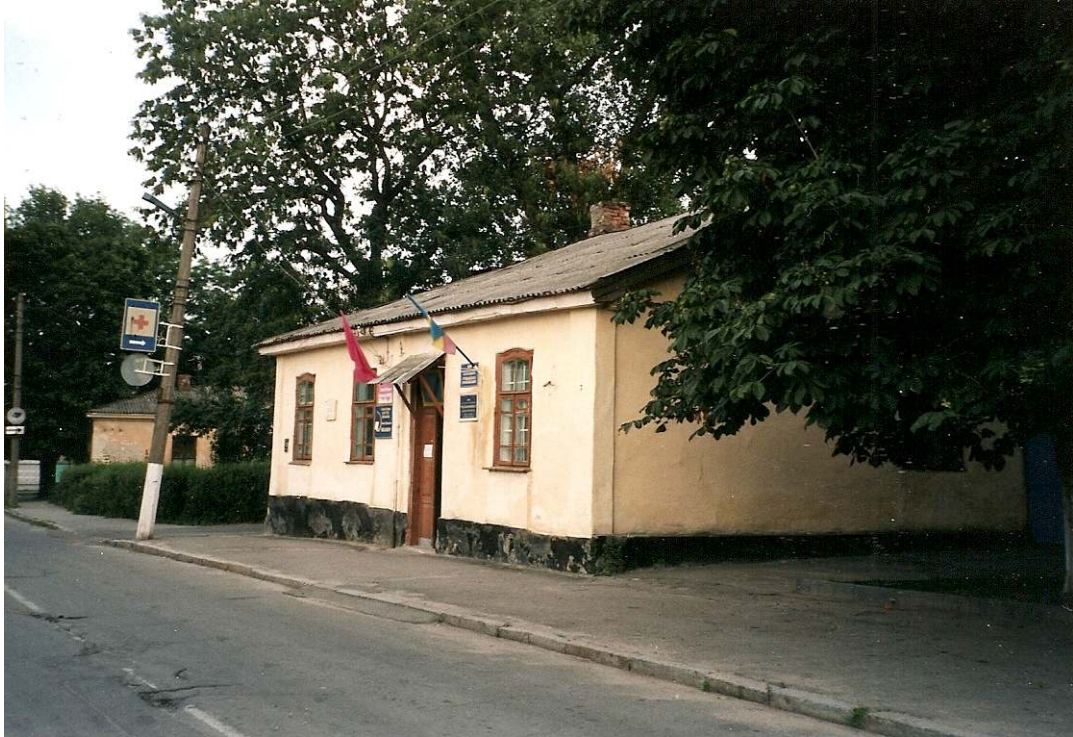
Бывшее здание НКВД по ул. И.Франка