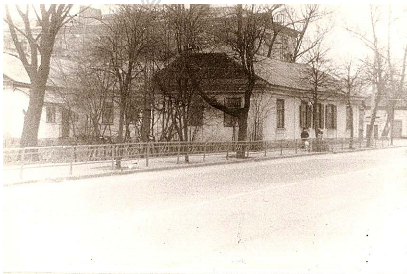
Дом по ул.Воли №4 в 1990-х гг.