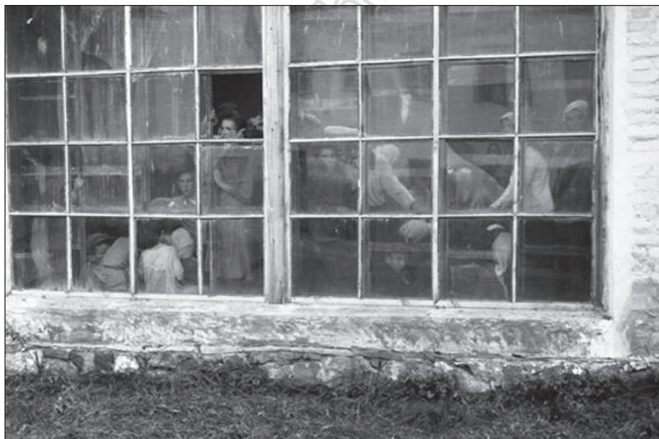
Ув'язнені в теплиці новоград-волинці в очікуванні розстрілу (фото 1941 року)

Коли останні наслідки перебування радянської установи в будинку поміщика були усунені, Мезенцев закотив бал. Для розваги дам був запрошений цвіт німецького офіцерства місцевого гарнізону. Проте, свято не вдалося. Зіпсували урочистості люди, які на бал зовсім не були запрошені. Дізнавшись про повернення поміщика та майбутній бал, партизани потай пробралися в Новоград-Волинський. У розпалі бенкету вони підпалили будинок і відкрили стрілянину. У перестрілці було вбито та поранено чимало учасників балу. Партизани без втрат зникли».