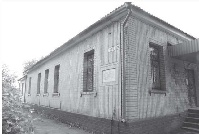
Будинок на вул. Волі, в якому відбулася нарада перших секретарів обкомів західних областей України щодо організації партизанського та підпільного руху

несення ударів тилам противника та надання допомоги фронтовим військам, які вели кровопролитні бої на головній лінії вогню – у смузі оборони Київського укріпрайону. Командирами цих формувань були призначені досвідчені спеціалісти з числа прикордонників.