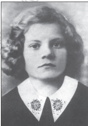
Лідія Боброва (1924-43)