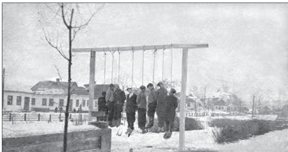
Шибениця на Сінній площі Новограда-Волинського (січень 1943 року)