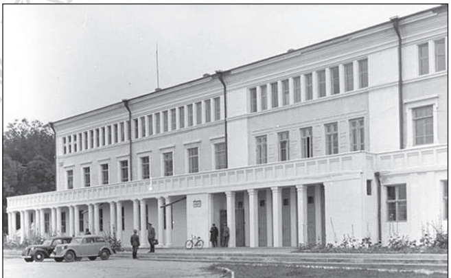
Гейтскомісаріат під час німецько-фашистської окупації був розташований у Будинку Червоної Армії (фото 1942 року)