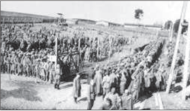
Табір радянських військовополонених (фото зроблено у м.Рівне, 1941 р.)