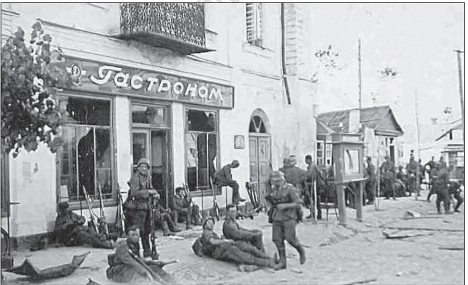
Солдати 1-ї танкової групи Клейста в центрі Звягеля незабаром після завоювання міста

Завдяки рішучим діям військ 5-ї армії, яка незважаючи на великі втрати в людях та бойовій техніці, відтягнула на себе всі сили німців, командування Південно-Західного фронту та уряд України мали можливість підтягнути