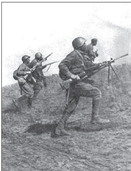
Червоноармійці в контратаці (фото 1941 року)