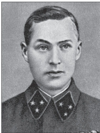
Командир 9-го механізованого корпусу Рокоссовський Костянтин Костянтинович (1896-1968)

На початку війни у боях брав участь, в основному, кадровий склад. Приписний склад із західних областей України, який знаходився на початок війни у військових частинах, майже весь розбігся додому.