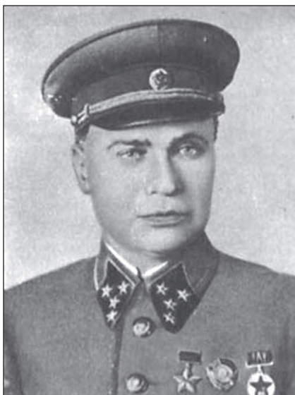
Командувач Київським особим військовим округом, Південно-Західним фронтом генерал-полковник Кирпонос Михайло Петрович (1892-1941)

— залишки 19-го механізованого корпусу – 1500 штиків, 3 танки, 57 гармат (на початку бойових дій корпус мав 450 танків, біля 30 тисяч особового складу, 920 автомобілів. У корпусі був величезний недокомплект особового складу і техніки: за штатом воєнного часу мало бути 1025 танків, 36 тисяч осіб, 2947 автомобілів, 920 мотоциклів);