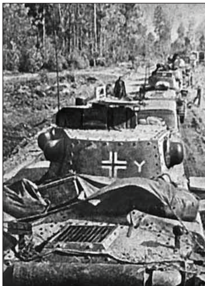
Німецькі танки на марші (фото 1941 року)

Першими ворога зустріли артилеристи 5-ї протитанкової артилерійської бригади, яка формувалась на початку війни