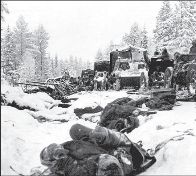
Радянська колона на Раатській дорозі поблизу Суомуссалмі

Становище підсилювала повна невідповідність 44-ї дивізії до ведення бойових дій в умовах суворої зими.