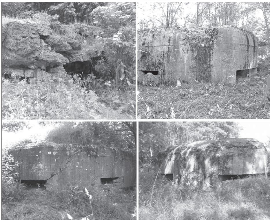
ДВТ Новоград-Волинського УРу (фото 2009 року)

Характеристика довгочасових вогневих точок: