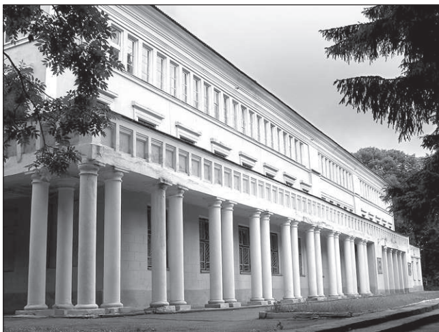
Будинок Червоної Армії, нині – Будинок офіцерів (фото 2009 року)

земельні ділянки для розташування військових містечок: будівництва казарм для особового складу, житлових будинків керівного складу, стаєнь, їдальні, крамниці, лазні, прального комбінату, Будинку Червоної Армії, шпиталю, школи, дитячого садку, водоканалізаційною системою та очисними спорудами; полігонів: