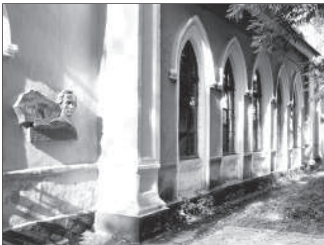
Приміщення поштової станції, де у 1935-1939 роках розміщувався штаб 45-ї стрілецької дивізії

За Ризькою мирною угодою від 18 березня 1921 року державний кордон України і Білорусі з Польщею проходив на 27 км західніше Новограда-Волинського (Корець-Польський). На відстані 27 км від кордону з Польщею знаходилась й столиця Білорусі Мінськ (Радошковичи-Польський).