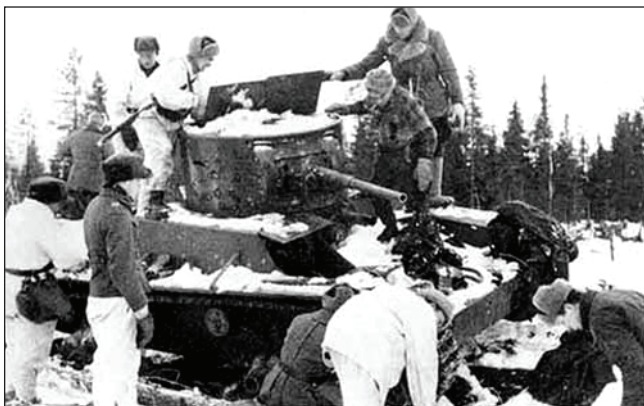
Фінські воїни оглядають трофейний радянський танк