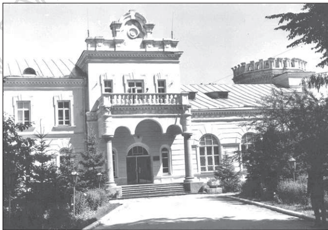
Будинок Б.С.Мезенцева – штаб 14-ї кавалерійської дивізії

Для військового будівництва була створена військово-