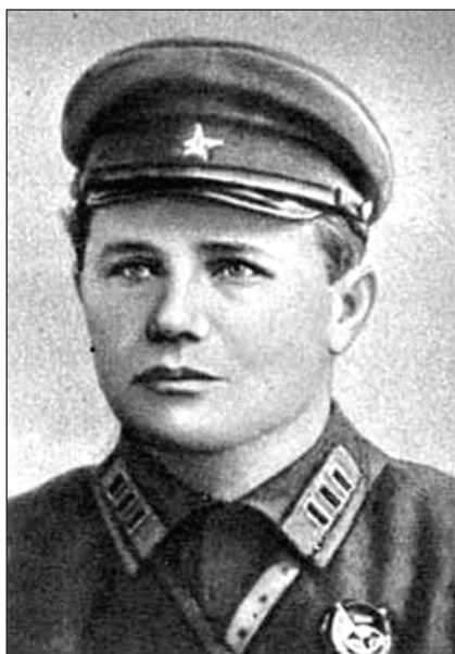
Срьоменко Андрій Іванович (1892-1970), 1935-37 – заступник командира, 1937-38 – командир 14-ї кавалерійської дивізії, Маршал Радянського Союзу (1955), Герой Радянського Союзу (1944)

— на заході міста, на 200 метрів північніше перехрестя доріг на Рівне, Коростень, Шепетівку розташовані дві ДВТ: кулеметна двоповерхова з броньованими ковпаками кругового обстрілу на чотири амбразури (у цій точці був розміщений командний пункт командира роти) та двокапонірна артилерійська точка, які були з'єднані підземним проходом довжиною 70 метрів.